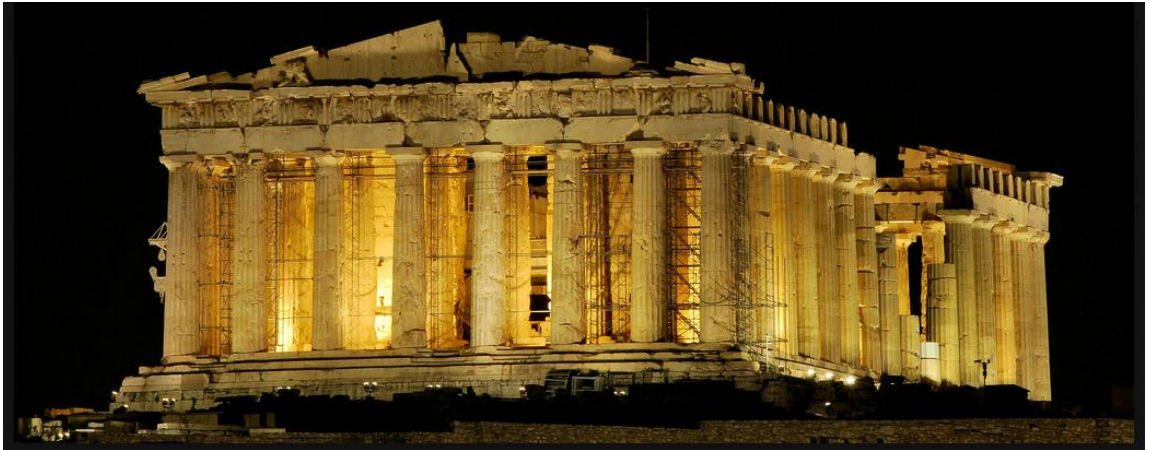
ΠΑΡΘΕΝΩΝ (The Parthenon), Athens, Greece (438 B.C.)