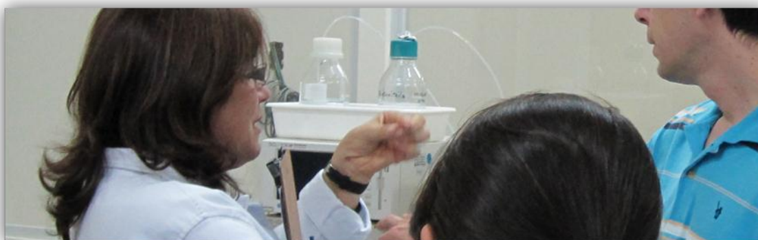
Aula de laboratório no IIC

A maior parte das disciplinas da Escola de Cromatografia possui aulas práticas para melhor fixação do conhecimento discutido na teoria (a relação das disciplinas a serem oferecidas em 2011 podem ser encontradas no final deste folheto, ou obtidas no IIC). Adicionalmente às disciplinas, ao longo do ano, serão oferecidos workshops, seminários e outras atividades complementares, que auxiliarão na transferência do conhecimento para os matriculados na Escola . Mais detalhes sobre os cursos podem ser encontrados no folheto sobre Cursos de Extensão do IIC.